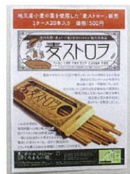
麦ストローのチラシ