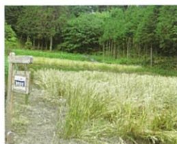
小麦栽培講習農地(惣代)

水稲の収穫後の11月に水はけが大切であることから、畝を立て、播種機を使用して、種まきします。