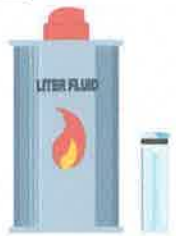
ライター・オイル