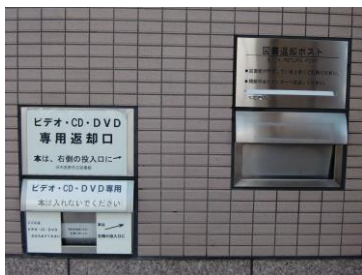
へんきやく 返却ポスト