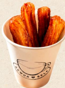
チュロス シュガー・きな粉 シナモン・ココア 400円