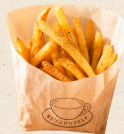
ポテト 450円 ふりふりポテト (バター醤油/コンソメ) 550円