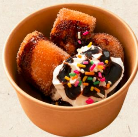
揚げパンカップ 600円