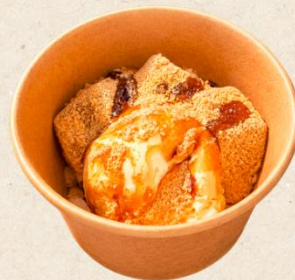
黒蜜わらび餅アイス 500円