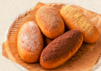
揚げパン シュガー・きな粉 シナモン・ココア 400円