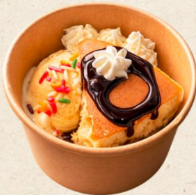
台湾カステラアイス 500円