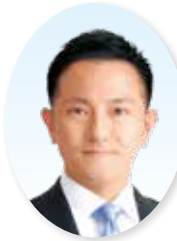
おくむら りょう 16. 奥村 亮 (45歳)

◎ 南花台在住 ■ 所属会派 自民党・無所属議員の会 ■ 所属政党 自由民主党 ■ 所属委員会等 議会運営委員会委 員、総務福祉教育常 任委員会委員長、予 算常任委員会委員、 広報委員会委員長