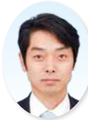
うらやま のぶゆき 14. 浦山 宣之 (58歳)

◎ 加賀田在住 ■ 所属会派 公明党 ■ 所属政党 公明党 ■ 所属委員会等 議会運営委員会 委員長、総務福祉 教育常任委員会 副委員長、決算常 任委員会委員長