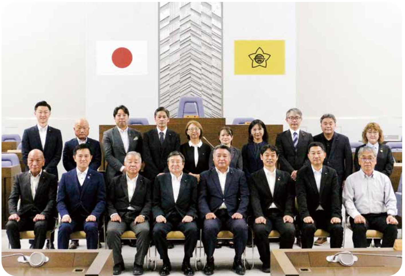
第19期 河内長野市議会議員