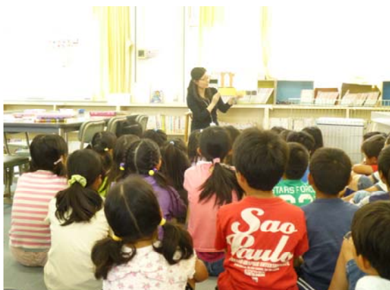
←学校図書館司書の読み聞かせ

このような観点から、国及び地方公共団体は、子どもの自主的な読書活動を推進する社会的機運の醸成を図るため、読書活動の意義や重要性について広く普及啓発を図るよう努めます。