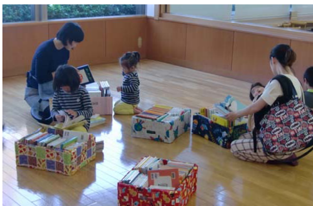
←図書館おはなしのへやでの親子の様子

図書館では、おはなし会や赤ちゃんタイム、夏休みのイベントなど様々な読書推進事業を行っています。