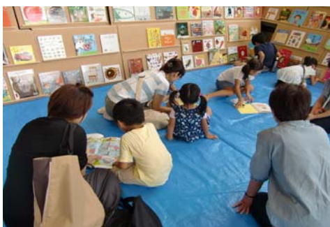
←キックスでの「えほんのひろば」

大阪府に対しては、市立図書館への支援や学校図書館の充実のため、必要な財政上の措置を講ずるよう働きかけていきます。