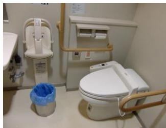
【しょう しゃよう 障がい者用トイレ 入りぐち ひだり しつない ようす みぎ 入口（左）と室内の様子（右）】