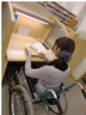
【くるま よう つくえ 車いす用の机】