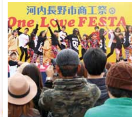
商工祭ワンラブフェスタ(11月)