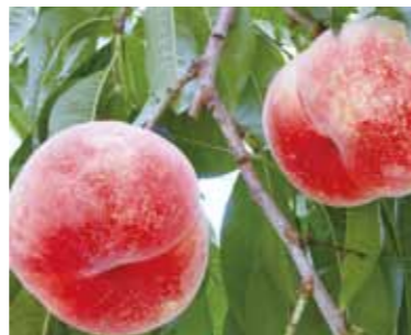
おやまだ 小山田の桃