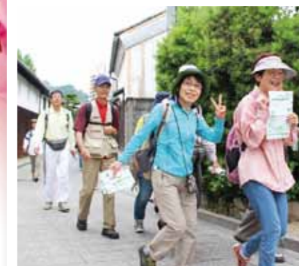
モックルウォーク(6月)