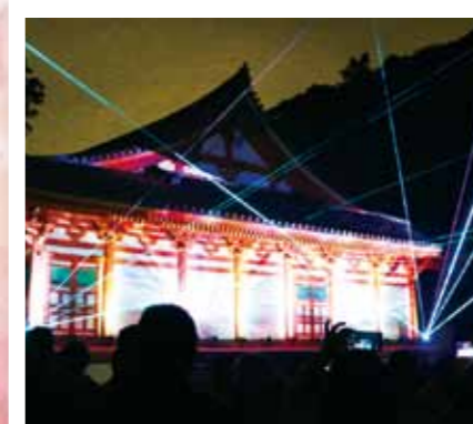
文化財ライトアップ(11月)