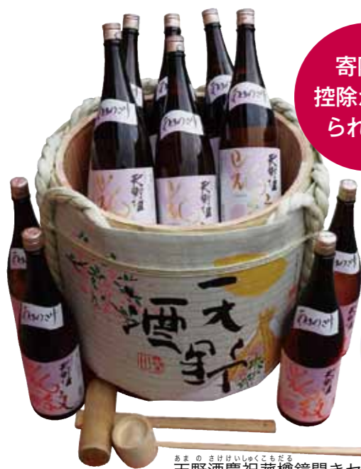
あまのさけいしゆくこもだる 天野酒慶祝孤樽鏡開きセット