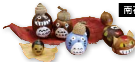
公園で集めたどんぐりに 親子でペイント