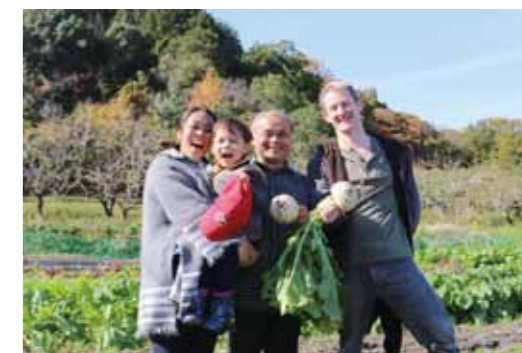
近所のおじいちゃんの畑で野菜を収穫

おじいちゃんの畑や稲刈りを手伝ったり、ザリガニを捕まえたり、新しいお庭に花を植えてみたり、友達とパーベキューをしたり、子どもの成長を家族みんなで見守りながら、暮らしを楽しんでいます。