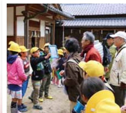
ぐるっとまちじゅう博物館(11月)