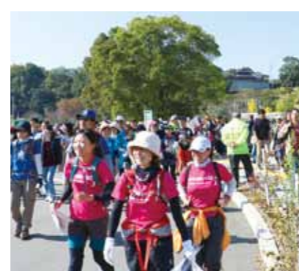
奥河内ロケイニング大会(10~11月頃)