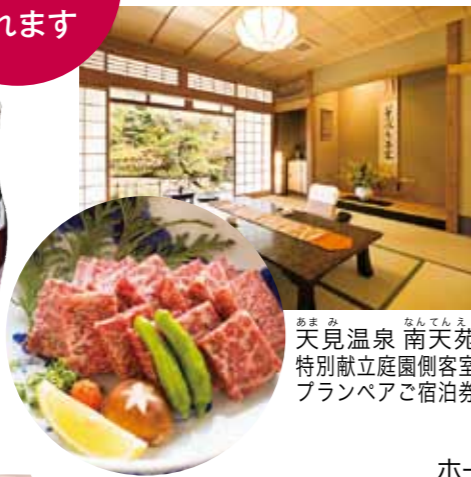
あまみ温泉 南天苑 特別献立庭園側客室 プランペア宿泊券