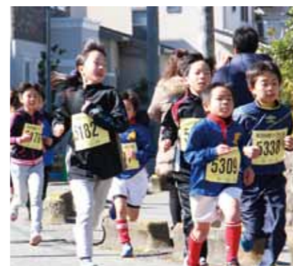
河内長野シティマラソン大会(2月)