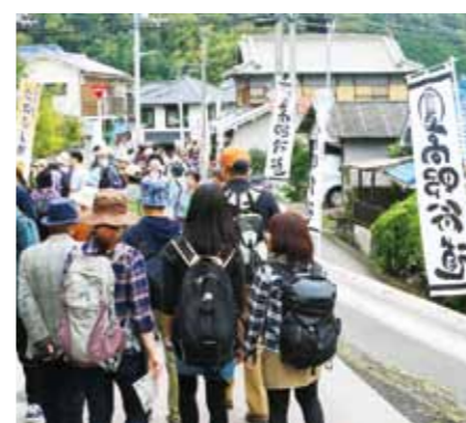
高野街道まつり(10月)