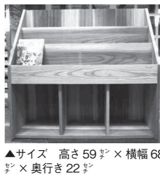
▲サイズ 高さ59センチ×横幅68センチ×奥行22センチ

マガジンラックをつくらう とき 4月24日(日)午前10時～午後4時 ところ 林業総合センター木根館 定員 12人（抽選） 参加費 7000円