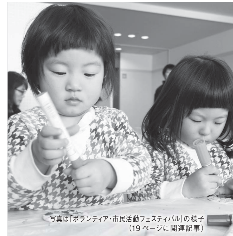
写真は「ボランティア・市民活動フェスティバル」の様子 (19ページに関連記事)