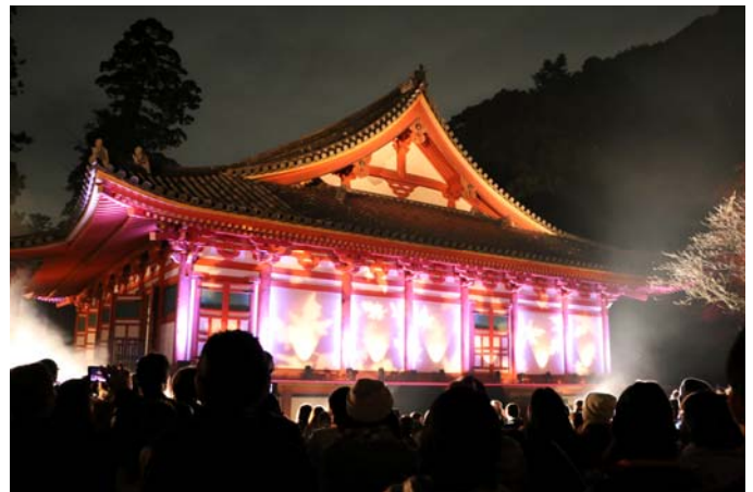
▲昨年のライトアップの様子（写真は金堂）

※今回ライトアップする金堂のある観心寺は、奈良時代に役小角が雲心寺として開き、827年に弘法大師の弟子、実恵が再興した。同寺の子院である中院は、楠木正成幼少の頃の学問所で、南朝ゆかりの寺としても知られるほか、春の桜、秋の紅葉、雪の冬げしきが美しいことでも有名。広い境内にある金堂は、全体の形式は和様であるが、細部に禅宗様をとり入れた折衷様の代表として早くから取り上げられ、昭和27年に国宝に指定された。