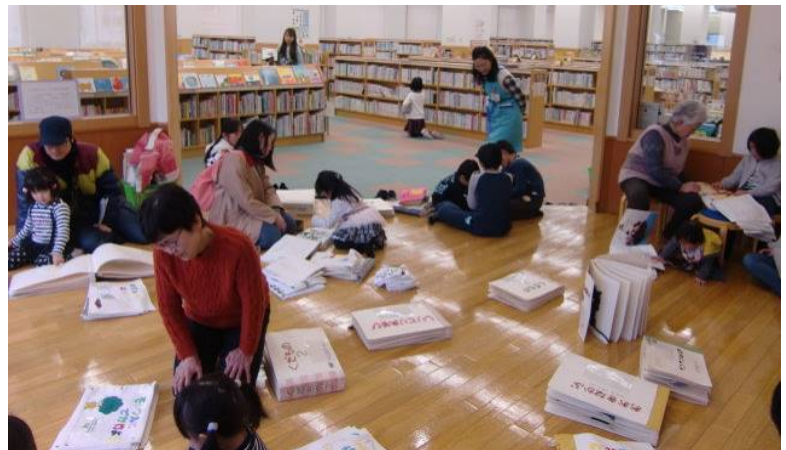
図書館での「さわる絵本・布の絵本大公開」

ボランティアグループ「さわる絵本の会 河内長野」による手作りの「さわる絵本」「布の絵本」をおはなしのへやで公開します。パソコンで読む本マルチメディアデジラーの実演もします。