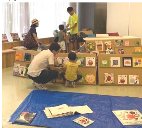
夏休み子ども教室（キックス）や ゆいテラスでの「えほんのひろば」 市主催イベントなどの依頼に 応じ、「えほんのひろば」を 出展しています。「えほんの ひろば」は市立小中学校でも 行っています。