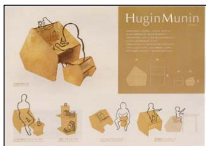
グランプリ 「Hugin Munin」