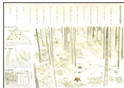
審査員特別賞 「山に生えた君の椅子。」

http://www.city.kawachinagano.lg.jp/kakuka/kankyukeizai/nourin/event/1483578581277.html