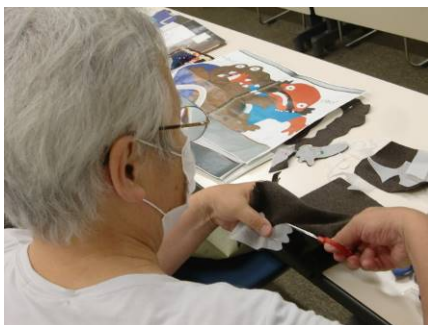
図書館での「さわる絵本・布の絵本大公開」

ボランティアグループ「さわる絵本の会 河内長野」による手作りの「さわる絵本」「布の絵本」をおはなしのへやで公開します。パソコンで読む本マルチメディアデイジーの実演もします。