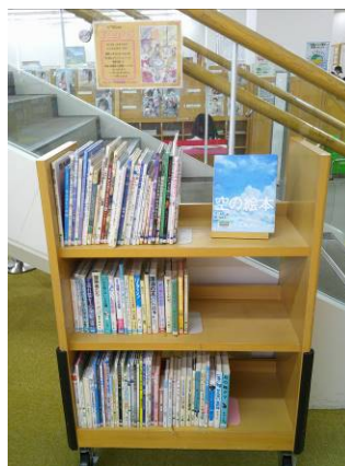
図書館での市立学校取組紹介