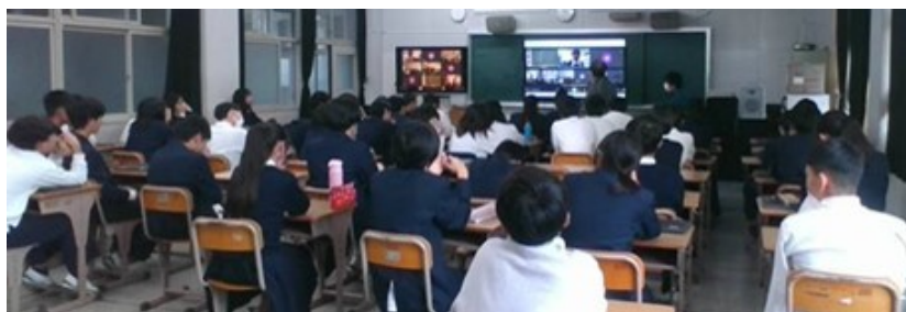
←市立小学校・中学校 B1

小学5年生と中学2年生を対象にした本の紹介合戦です。ICTも活用し、学校間の交流の場で紹介しています。