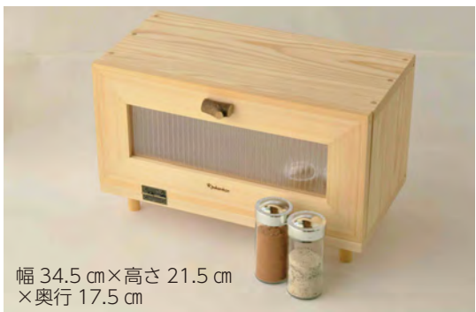
幅 34.5 cm×高さ 21.5 cm ×奥行 17.5 cm

●ガーデニングのお悩みをズバリ解決 やさしい時間(NHK出版)などで記事連載中の牛迫正秀さんが、薬剤だけに頼らない、家でも簡単にできる病害虫対策を分かりやすく解説します。 とき 2月14日(土)午後2時～4時 ところ キックス 定員 200人(先着順) 申込 1月12日から電話で左記へ 岡公園緑化協会 (☎56・1155)