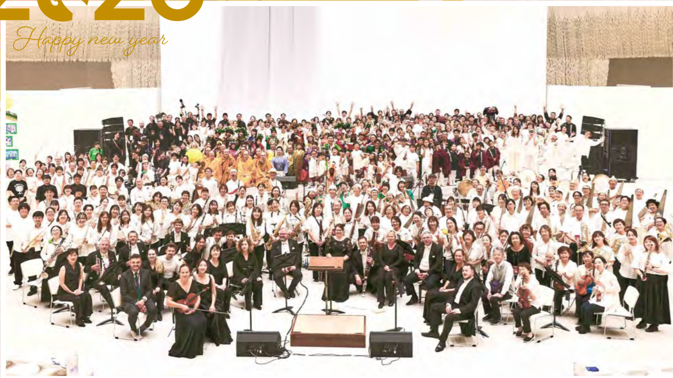
2025 年、大阪・関西万博で上演した「奥河内音絵巻 2025」の参加者と一緒に