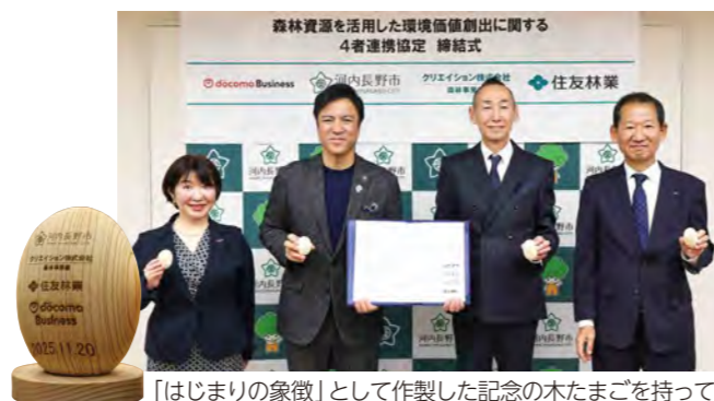
「はじまりの象徴」として作製した記念の木たまごを持って

4者による連携協定を締結 市は、本プロジェクトにおいて連携協定を締結しました。この協定に基づき、J-クレジットの創出・販売支援など持続可能な森林管理の仕組みづくりを担います。 ◎クリエイション(クレジット創出者) 林業経営体として本市の森林を実際に整備・管理する ◎住友林業、NTTドコモビジネス J-クレジット創出に必要なデータ整理や申請・販売を支援し、森林や林業に関する助言を行う この協定により、市・林業事業者・企業が一体となって、脱炭素社会の実現と地域活性化の両立をめざします。