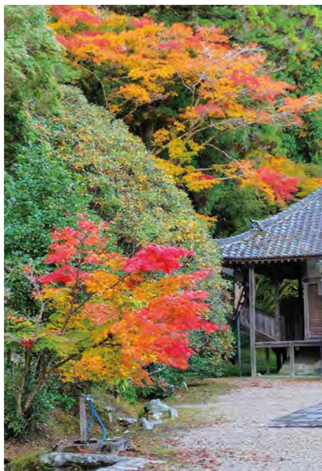
市民投稿「ちょっと見てみて!」より 応募者：花迫い人

※その他ごみの分別方法については下記QRをご確認ください。 環境衛生課 資源となるごみの 持ち込みについて 左記のものは、資源選別作業所（上原西町2の28）へ持ち込みが可能です（①～③は家庭で使用していたものに限る）。 受付時間 月～金曜日（祝日を除く）午後1時～3時 ①電子レンジ・掃除機・ストーブなど一部の粗大ごみ（粗大ごみシールの貼付が必要） ②パソコン・携帯電話などの小型家電（ごみシール不要）