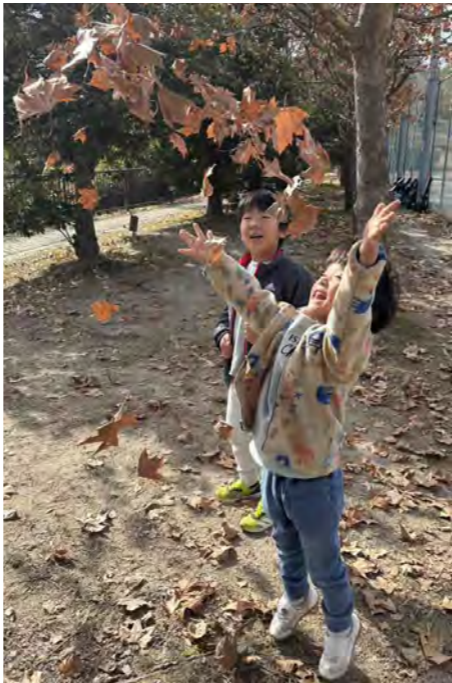
市民投稿「ちょっと見てみて!」より

所得税の確定申告をする際にお使いください。 なお、障害年金や遺族年金は、非課税所得であるため、源泉徴収票は送付されません。 ●電子版の送付 「公的年金等の源泉徴収票」は、e・Taxで利用できる電子版の交付も行っています。マイナポータルから「ねんきんネット」にログインし、電子送付希望の登録をすると、「お知らせ」で受け取ることができます。 ※詳細は、同機構ホームページでご確認ください。 ※電子版の登録を行っている人には、郵送による源泉徴収票の送付はありません。 ●日本年金機構天王寺年金事務所（☎06・6772・7531）