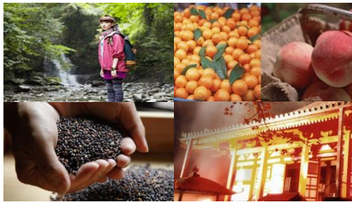
展示テーマのイメージ