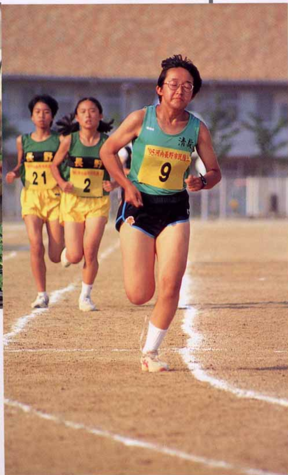
市民体育祭（陸上競技）

市民一人ひとりが心豊かで、やさしさや思いやりといった人間性あふれる生活を創出できるように、多様なニーズに対応した生涯学習環境の整備をすすめるとともに、市民が楽しみながら、気軽に参加できる市民文化や生涯スポーツの振興をはかります。さらに、次代を担う青少年が豊かな感性や創造性、思いやり、モラルをもって健やかに成長できるまちづくりをすすめます。