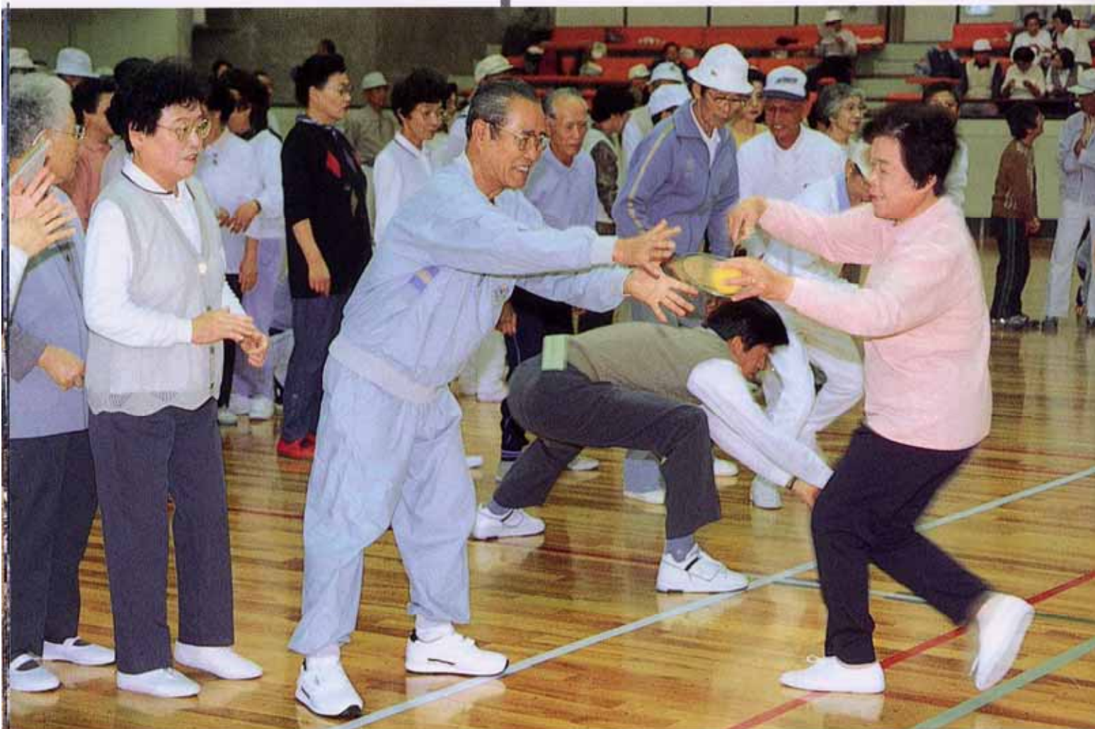
老人スポーツ大会

市民が生涯を通じて、健康で生きがいをもって日常生活をおくれるように、思いやりやぬくもりのある人づくりをはじめ、社会に参加して役割をもち、相互に助けあえる、笑顔あふれる豊かなまちづくりをすすめます。