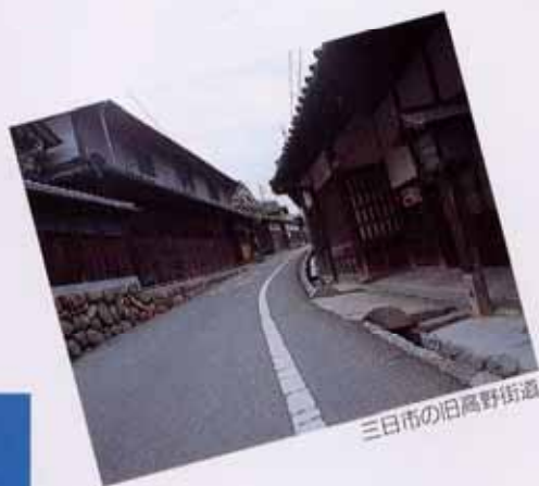
三日市の旧高野街道