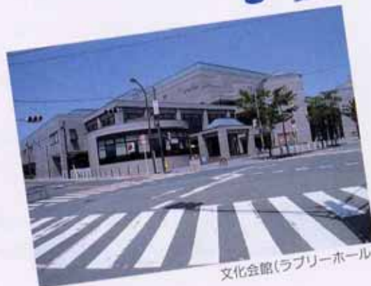
文化会館(ラプリーホール)