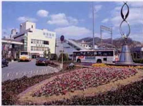
河内長野駅前再開発