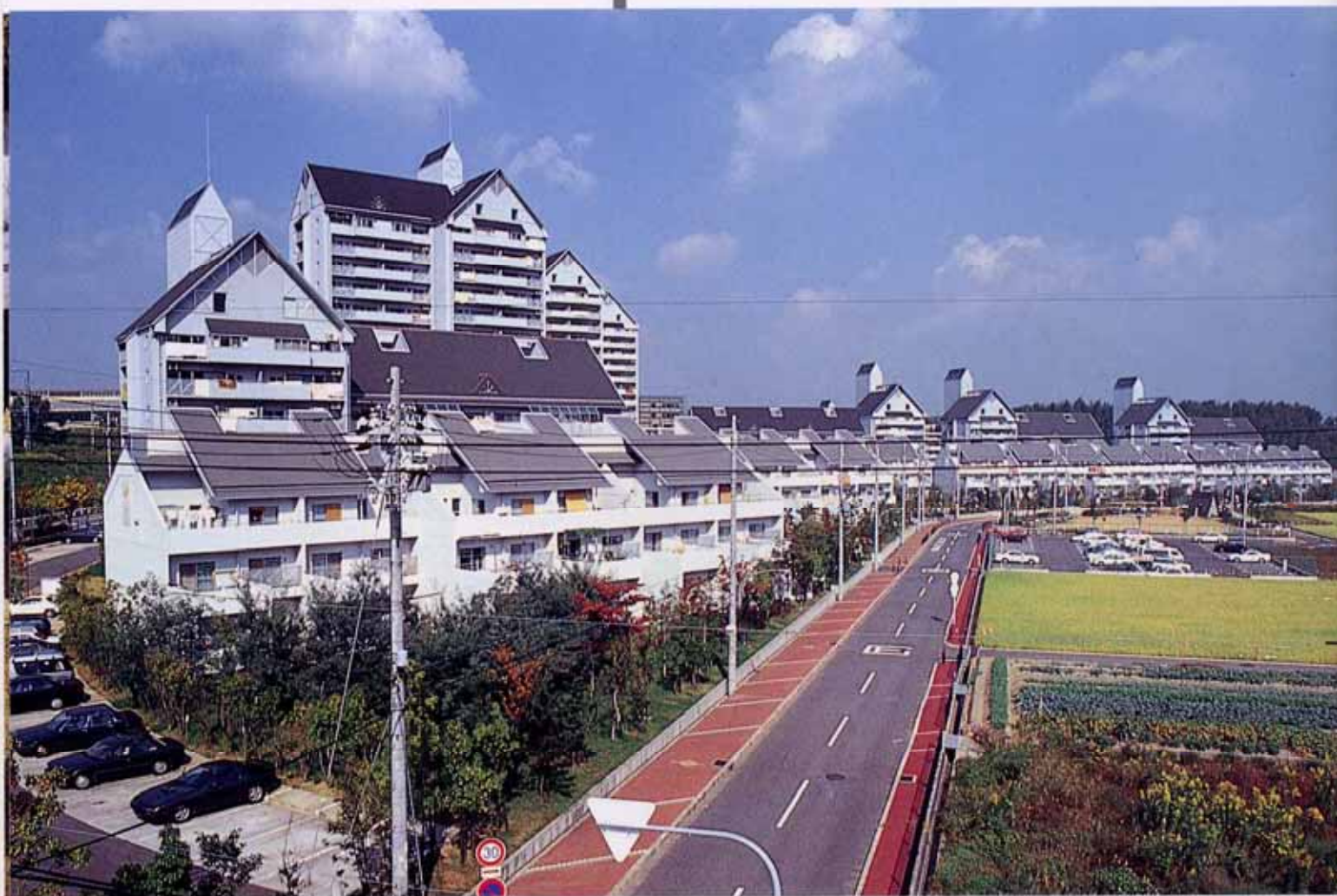
整然と整備された向野住宅街区

さらに、市民が主体となってまちづくりに参加し創意が生かせるような施策づくりをはかり、安全で快適なまちづくりをすすめます。