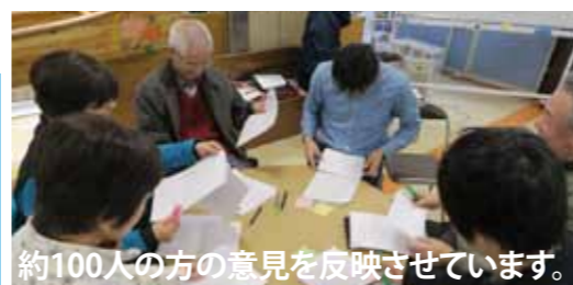
約100人の方の意見を反映させています。