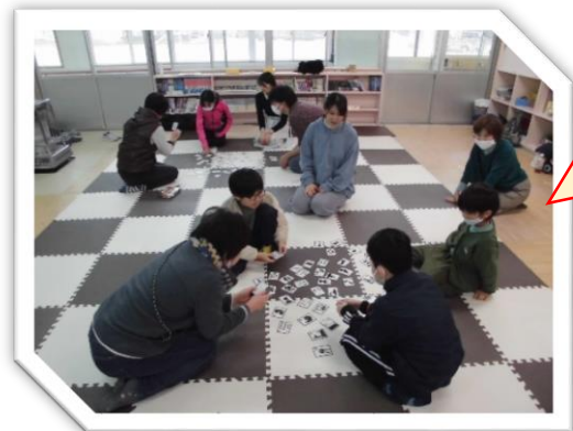
チームに分かれてカルタ大会