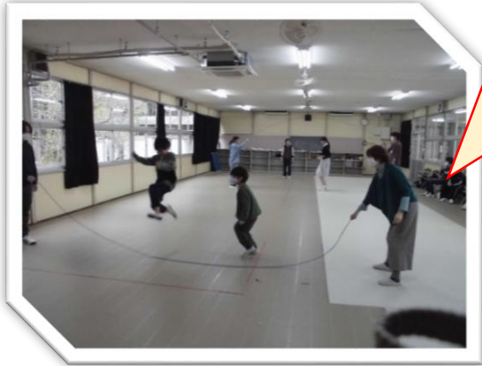
ながなあ、三十回もどべたよ!