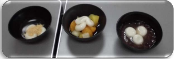
白玉だんごアレンジ3品