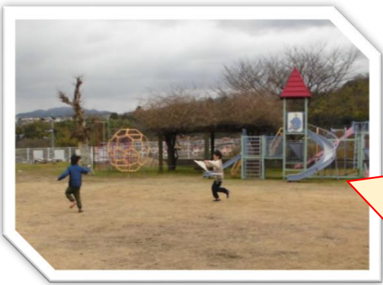
たこたこ、あーかれ、それっ!