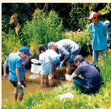
水生生物観察会の様子