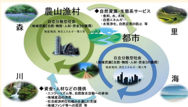
地域循環共生圏の概念図