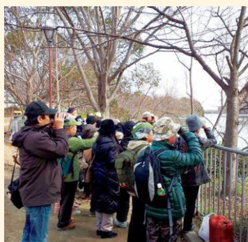
野鳥観察会の様子