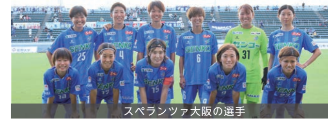
スペランツァ大阪の選手