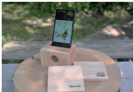
▶高さ6センチ×幅10センチ×奥行7.5センチ

木根館の催し ●スマホスピーカー&ペアコースター スマホサイズにあわせた木製スピーカーをヒノキとスギを組み合わせて作ります。 とき 10月29日(日)午前9時30分〜正午 定員 12人(先着順) 参加費 2000円(材料費込) 申込 9月7日から電話かメール(event@sinrin.org)住所、氏名、年齢、電話番号、催し名を記入)で同館へ