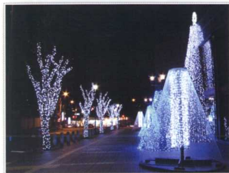
ラプリーホールのウインターイルミネーション 午後5時～10時 12月25日(日)まで点灯中

★次回は3月の発行で、長野小学校区まちづくり会議～ゆめ・街・ながの～参加団体の紹介を予定しています。