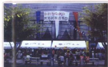
かわちながの世界民族音楽祭 H23.9/18

■地域で活動する団体を紹介します 次回3月号では、長野小学校区まちづくり会議～ゆめ・街・ながの～へ参加されている各団体の活動を紹介します。これからも、団体や住民同士で互いに交流しながら、地域の絆を深めていきます。