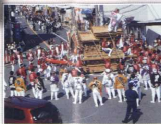
秋のだんじり祭り H23.10/8.9