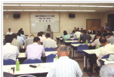
長野小学校区まちづくり会議～ゆめ・街・ながの～設立総会 平成23年7月27日