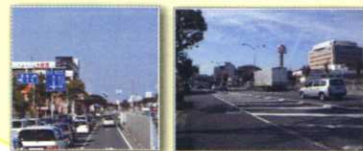
校区の玄関口である大阪外環状線