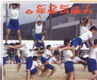
長野小学校秋の運動会 H23.9/25