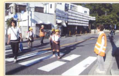
長野小学校区連合自治会による子ども見守り活動

長野小学校区まちづくり会議～ゆめ・街・ながの～においても、一人ひとりが万が一の場合でも安心して暮らせるよう、校区一体となって取り組むことが必要であると考えています。