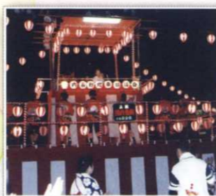
地車ふれあい盆踊り大会 H23.7/23