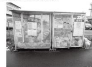
▲ごみ集積所を町内会代わりにも活用し、みんなが集まるのでコミュニケーションの場にもなる。

「集積所は町内会行事の案内の掲示や、ごみを出しに来た方と世間話をするなどコミュニケーションの場にもなっています。だから、いつもきれいにしなないと」と誇らしげに話されている様子も印象的でした。今後も環境事業所と連携を深めながら、できるだけ自分たちの力で地域をきれいにしていきます、との力強い言葉をいただきました。