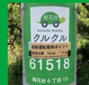
定時定ルート乗降ポイント