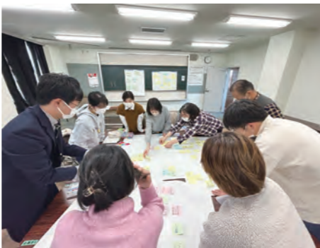
▶大阪教育大学の講師と楽しくコミュニケーションを深めます。