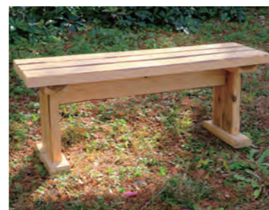
▲横 100cm × 奥行 30cm × 高さ 40cm

木のある暮らし森のベンチ 木目の美しさと木の香りを楽しめるおおさか河内材のヒノキとスギを使用します。ピス止め穴の墨付け、組み立て作業を行い、自分でベンチを