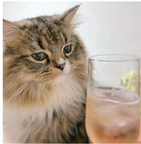
それは何だ？ byシビ なんでも気になる子です

※対象条件や申請方法など詳細は問い合わせください。 保健センター ☎55・03001