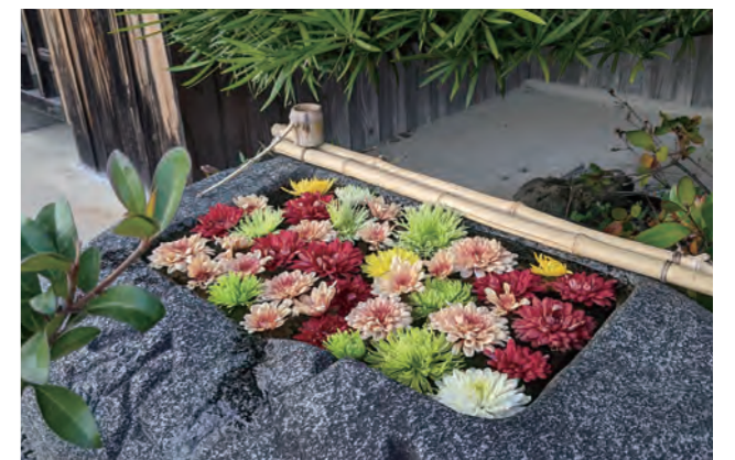
大日寺の花手水 byまこ

お参りに来られた方が少しでも癒されるようにと、時々ですが、季節のお花が境内の手水鉢に浮かんでいます。