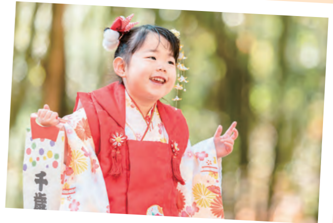
七五三 byすももどん