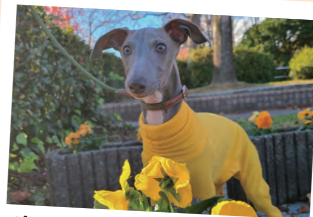
寒さに負けないぞ！ byナイルママ

お参りに来られた方が少しでも癒されるようにと、時々ですが、季節のお花が境内の手水鉢に浮かんでいます。