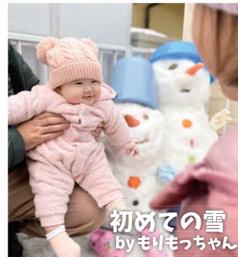
初めての雪 byもりもっちゃん

クリスマスイブに積もった雪で、一生懸命に雪だるまを作りました。とっても大きくて、子どもたちだけでは持ち上げられないくらい！三女はビックリしながら初めての雪に幸せな笑顔を見せてくれました。