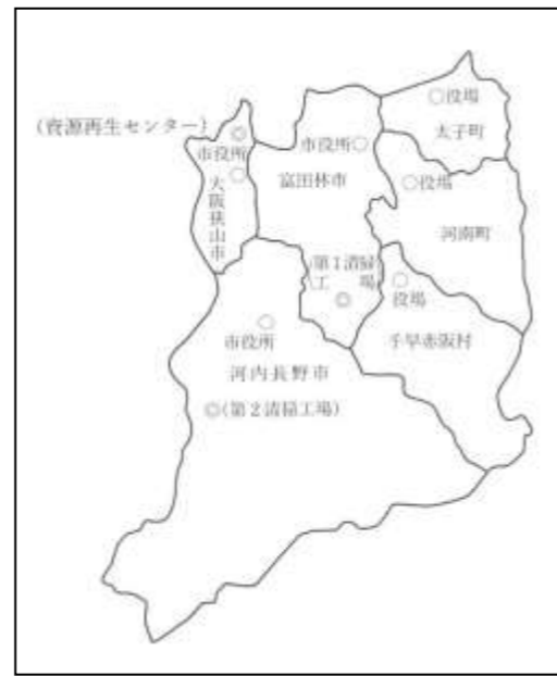
南河内環境事業組合の管内区域図