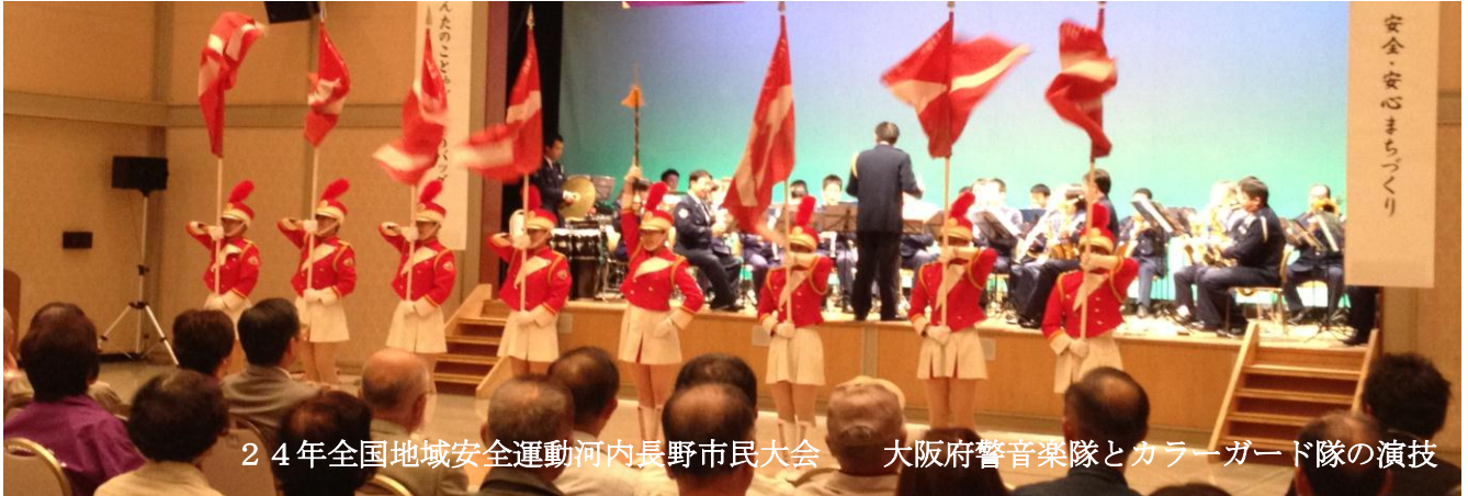
24年全国地域安全運動河内長野市民大会 大阪府警音楽隊とカラーガード隊の演技