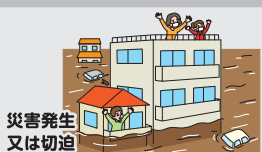
災害発生 又は切迫