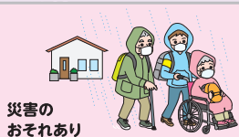
災害の おそれあり