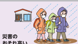
災害の おそれ高い