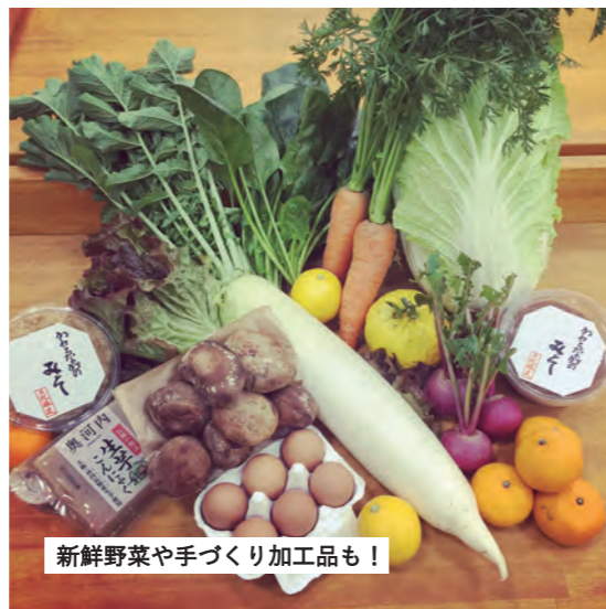
新鮮野菜や手づくり加工品も!