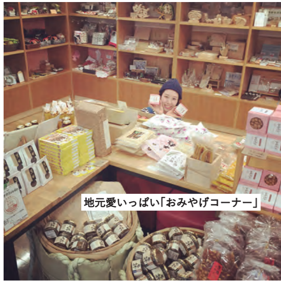
地元愛いっぱい「おみやげコーナー」