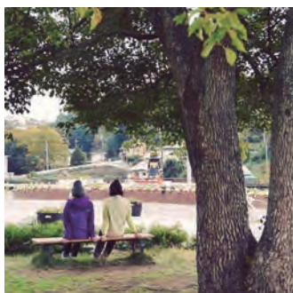
のんびり休憩「奥河内くろまろの郷」P.03-04