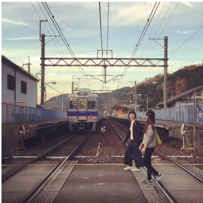
山あいの駅で下車すると思わず深呼吸したくなる