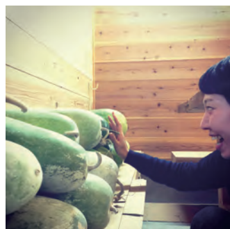
地元の野菜がいっぱい「大地の里 友邦」P.08