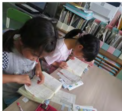
←中学校図書室でのおためし読書

「学校読書推進目標」に基づき、各教科等の授業で学校図書館が計画的に活用されるよう取り組まれています。