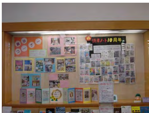
←公立小学校での読書ノート取組紹介

公立小学校で取り組んでいる「読書ノート」について、図書館展示ケースにて紹介しました。