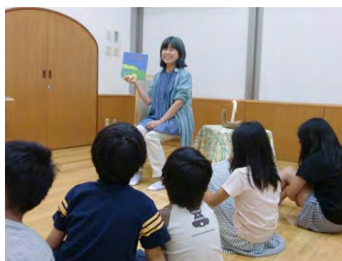
←図書館「おはなし会」