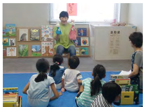
夏休み子ども教室でのおはなしとてあそび キックスで開催された「夏休み子ども教室」の「えほんのひろば」にて、おはなしとてあそびを楽しみました。

公立小学校で取り組んでいる「読書ノート」について、図書館展示ケースにて紹介しました。