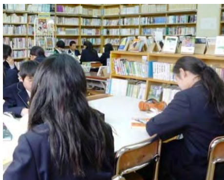
小学校図書室での辞書引き学習→

あるテーマに関する資料や情報を収集する手順をまとめた情報検索ツール・調べ方ガイドのこと。利用者のニーズに合わせて具体的なテーマ（例えば「世界遺産」「環境問題」など）ごとに作成されます。