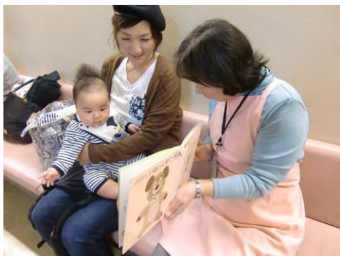
←乳幼児健診センターでの 「ようこそ えほんといっしょ」

4か月健康診査時にボランティアによる読み聞かせ、利用者カードの発行、ブックリストの配布などを行っています。