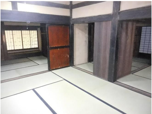
座敷廻り建具建付け、豊敷施工状況