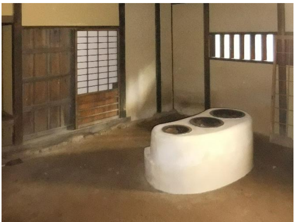
土間のかまど漆喰上塗り施工状況