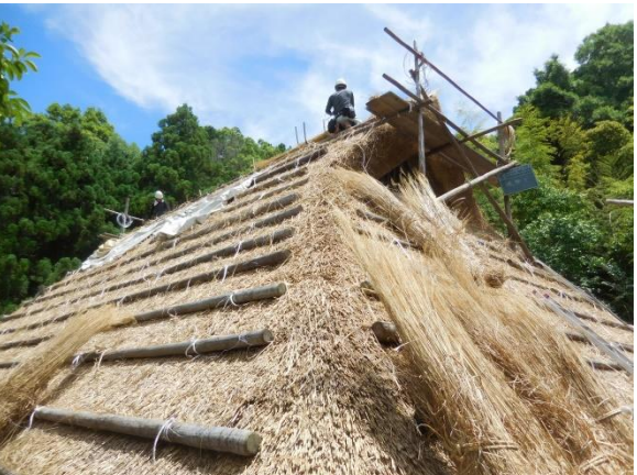
茅葺屋根妻側施工中