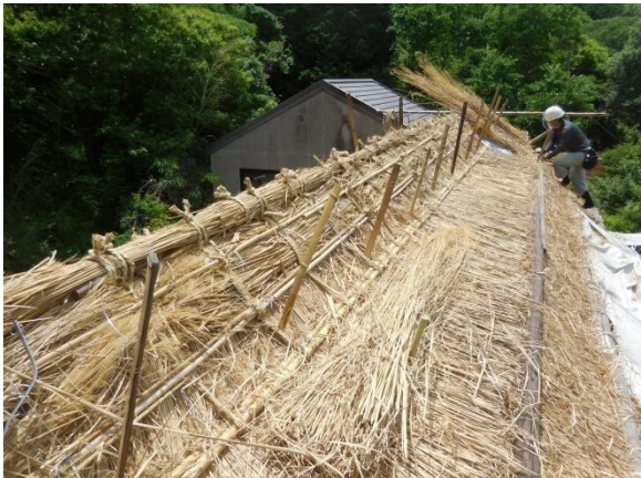
茅葺屋根棟造り施工中

修理は「屋根葺替及び部分修理」とし、主に屋根を山茅で全面葺替えています。現在、平葺き部分を葺き終え、棟造りの施工中です。その他、破損部分を解体して傷んだ木部の繕い、剥落した土壁の塗替え、簀子天井の補修を行っています。また、建具の補修、かまどの化粧直しや畳の取り替えなど、部分修理も行う予定です。