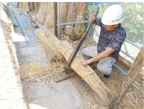
敷込み用茅材加工状況