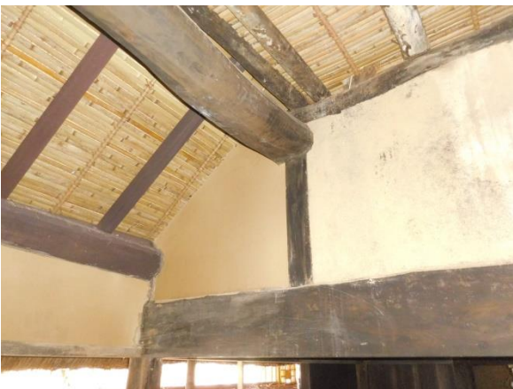
部屋内小壁土塗乾燥中