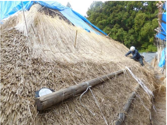
茅葺屋根平葺施工中