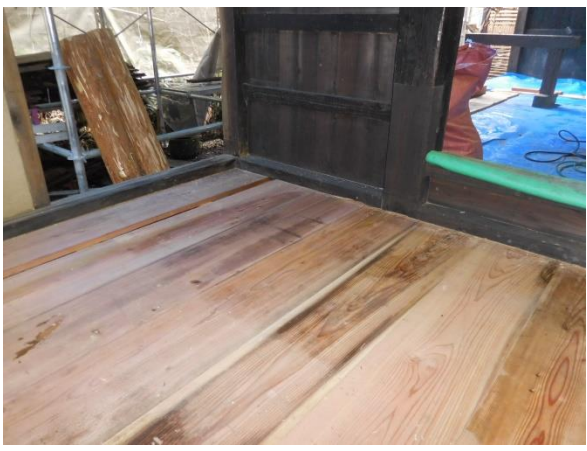
畳下の床板補修状況