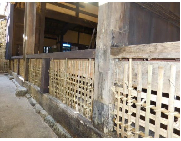
床下小壁木舞掻き施工状況