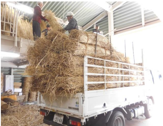
茅材搬出中（ふる森センター保管庫より）

工事着手に先立ち修理委員会を組織して、補助金事業運営にあたっていきます。修理は「屋根葺替および部分修理」とし、主に屋根を山茅で全面葺替えています。その他、破損部分を解体して傷んだ木部の繕い、剥落した土壁の塗替え、簀子天井の補修を行っています。また、建具の補修、かまどの化粧直しや畳の取り替えなど、部分修理を行います。