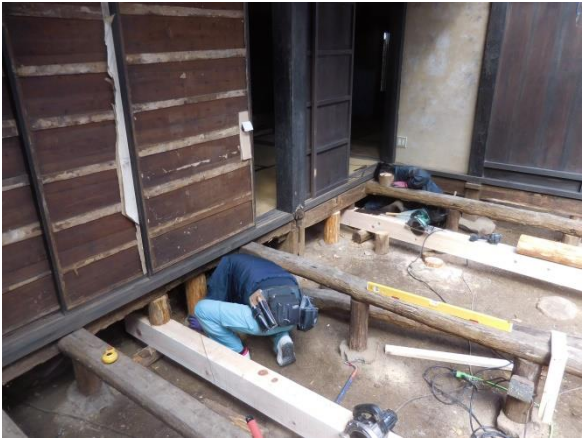
床組の木部材補修中