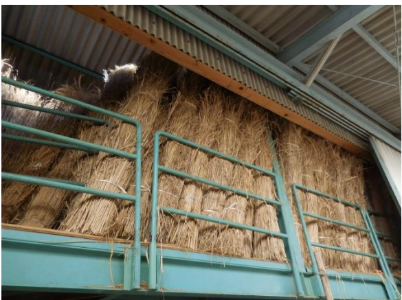
山茅の保管収納状況