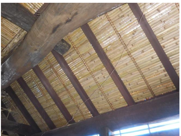
下屋割竹簀子天井の補修状況