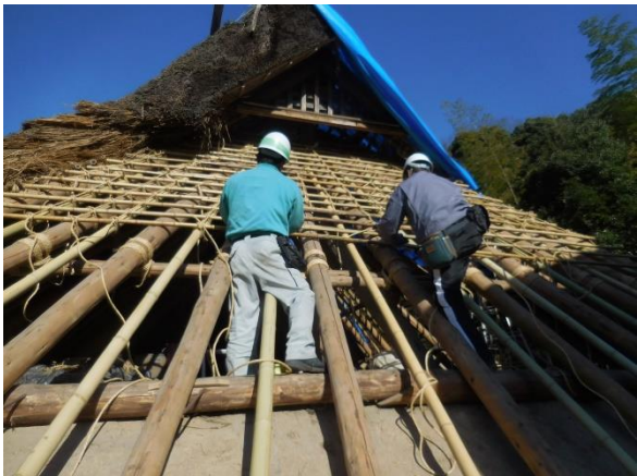
茅葺下地の木舞竹編み施工中

工事着手に先立ち修理委員会を組織して、補助金事業運営にあたっています。修理は「屋根葺替および部分修理」とし、主に屋根を山茅で全面葺替えています。その他、破損部分を解体して傷んだ木部の繕い、剥落した土壁の塗替え、簀子天井の補修を行っています。また、建具の補修、かまどの化粧直しや畳の取り替えなど、部分修理を行います。