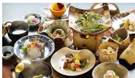
あまみ温泉 南天苑

※対象メニューなど最新情報については市ホームページ、またはコールセンターにお問い合わせください。