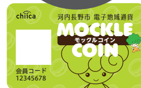
モックルコインカード