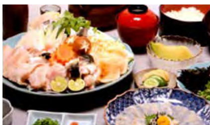
おばな旅館 富貴亭