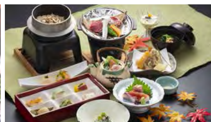
天然温泉 河内長野荘