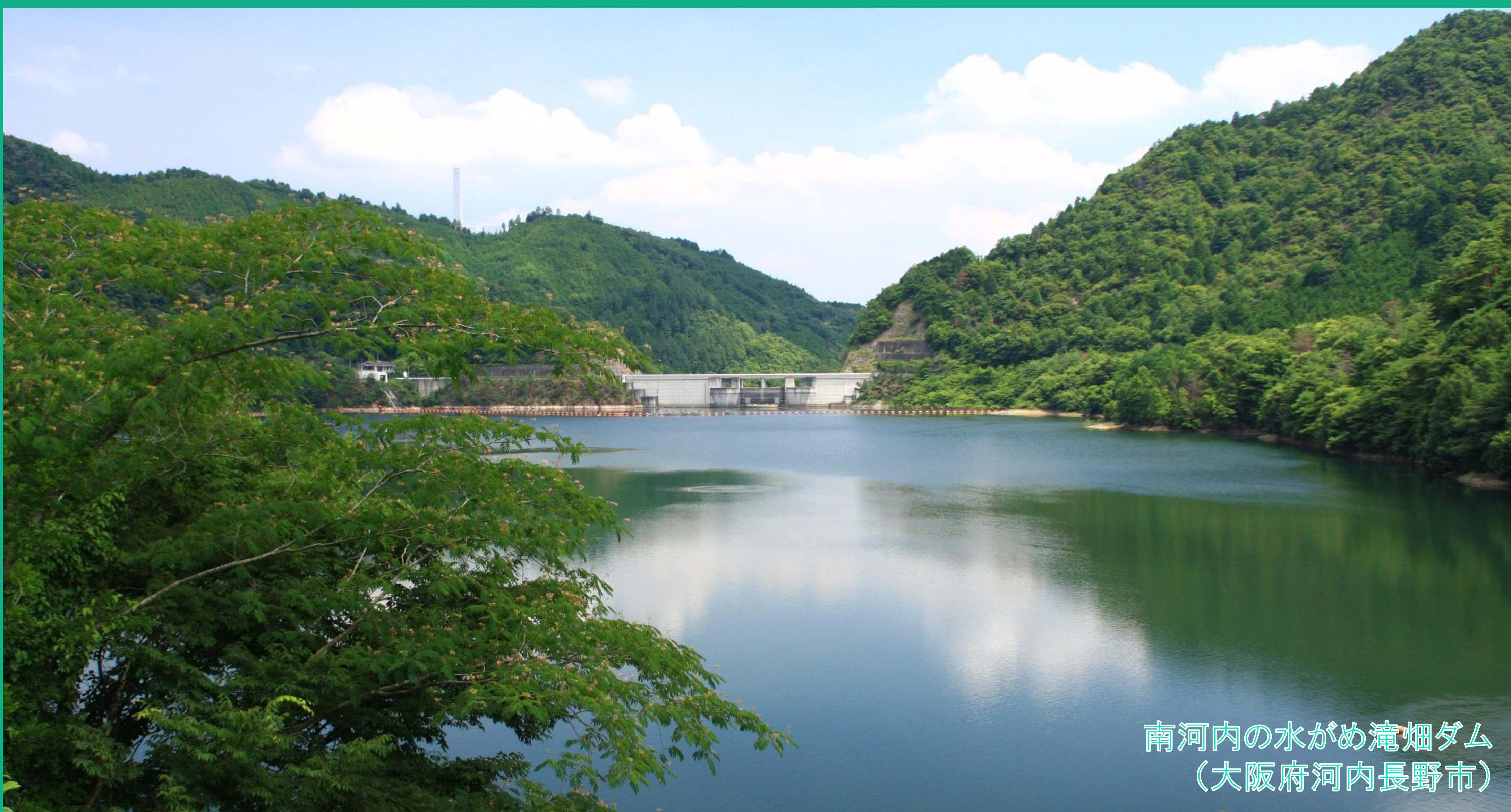
南河内の水がめ滝畑ダム (大阪府河内長野市)