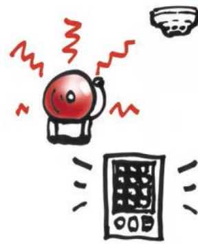
自動火災報知設備