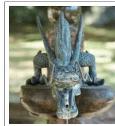
#観心寺#手水の龍#飲まれそうな迫力#P4