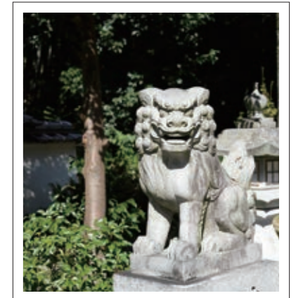
#青賀原神社#イケメンな狛犬の笑顔#P15