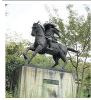
#観心寺#楠木正成公の像#P4