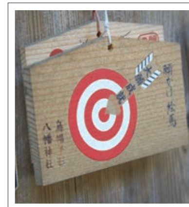
#烏帽子形八幡神社#願いをこめた絵馬#P14