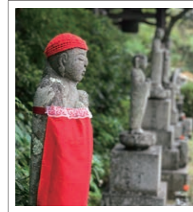
#延命寺#赤い前掛けのお地藏さん#P8