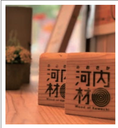
#道の駅#河内材(スギ・ヒノキの木材)#P27