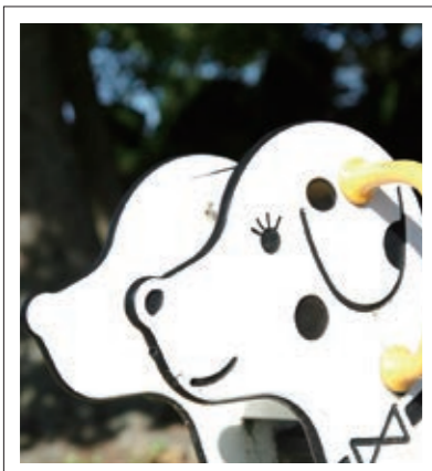
#寺ヶ池公園そば#懐かしいスプリング遊具#P15