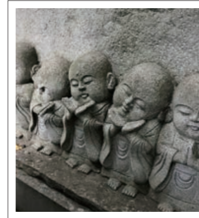
#興禅寺#可愛すぎる地藏にキュン#P8