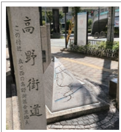
#河内長野駅近く#東西高野街道合流地点