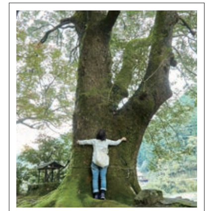
#八幡神社#樹齢300年のイチョウ#P13