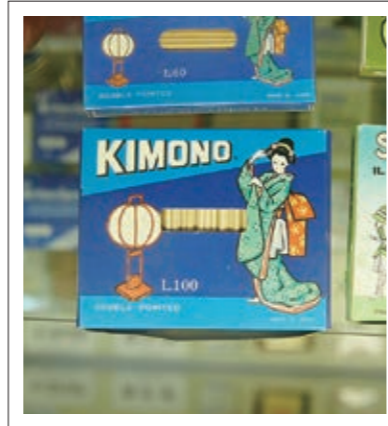
#つまようじ資料館#レトロ感に魅せられて#P12