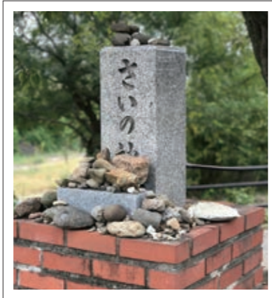
#花の文化園近く「さいの神」#石はお供え物#P6