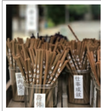
#観心寺#太いお線香#何を願う?#P4