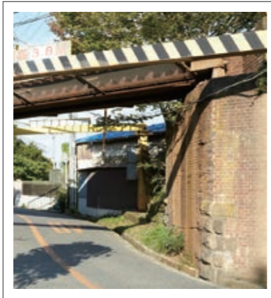
#レンガの橋脚#街のそここに発見!#P11