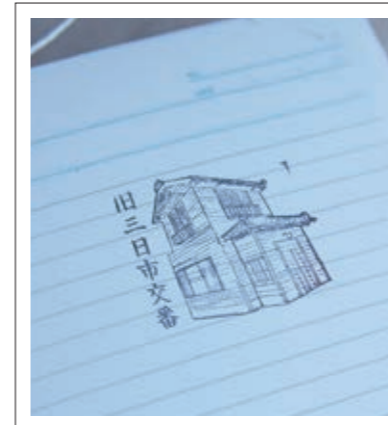
#旧三日市交番#懐かしスタンプ#P13