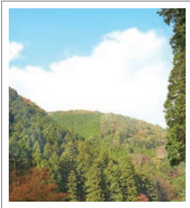
#光滝寺キャンプ場#ダム上流は自然豊か#P18

河内長野市を歩いていると「インスタ映え」のスポットにたくさん出会います。 カメラやスマホ片手に旅をして、あなたのSNSにじゃんじゃんアップしてください。