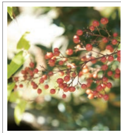
#川上神社#南天の実#難を転じてくれるかな#P16