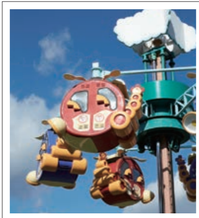
#関西サイクルスポーツセンター#乗りたい#P18