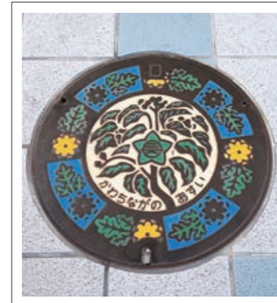
#くすの木のマンホール#足元にも注目