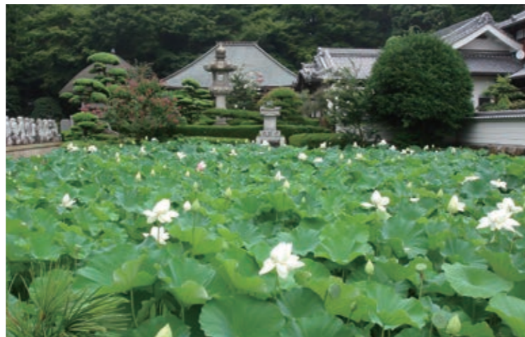
興禅寺の斑蓮 広域マップ：C-3 アクセス 美加の台バス停より徒歩15分

興禅寺(→P08)は、1000年余り前から咲き続けているという真っ白な斑蓮で有名です。7月から8月頃には、早朝に花を咲かせる斑蓮の姿を見ようと多くの人が訪れます。夜明け頃には、開花時に出る「ポーン」という音が寺中に響き渡り、1日の始まりを知らせてくれるといいます。