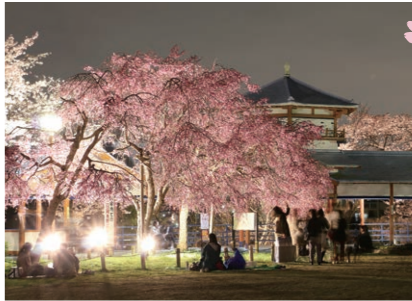
長野公園の夜桜(奥河内さくら公園) 広域マップ：C-2

南部に広がる滝畑、岩湧山周辺の風光明媚な自然風景や、桜、紅葉などで彩られる各所の社寺など。季節を雄弁に伝える大阪府下とは思えないスポットが河内長野にはたくさんあります。イベント情報も併せてチェック！