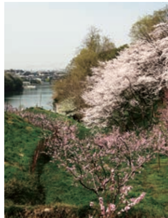
寺ヶ池公園の借景 広域マップ：C-1

アクセス 河内長野駅より徒歩7分 河内長野駅から徒歩5分。市内を一望する長野公園は、春になると250本以上の桜の花が咲き誇る花見の名所です。特に、訪れる人を魅了するのが夜桜。ライトアップされた風景は、幻想的で艶やかで情緒たっぷり…。昼間とは違う桜の魅力を堪能してみませんか。