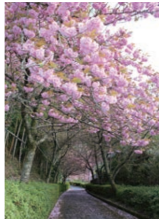
天見の八重桜 広域マップ：D-4

アクセス 天見駅から徒歩すぐ 南海高野線天見駅の改札を出て左手には、八重桜の木々が咲き並ぶ遊歩道が。河内長野市民の有志の寄贈により手植えされたもので、4月中旬頃に見頃を迎えます、100駅ある南海電鉄で選定されている「南海電鉄100駅自慢」にも選出されている河内長野自慢の桜通りです。