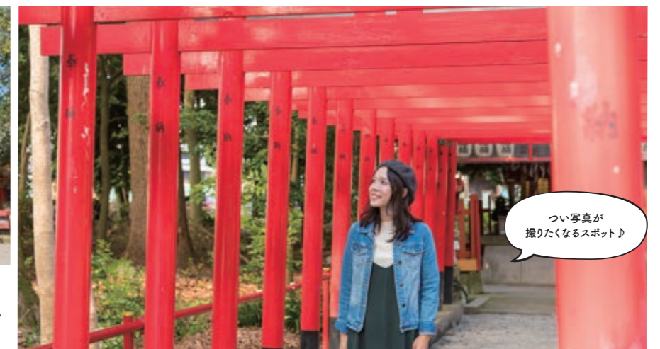
つい写真が撮りたくなるスポット！