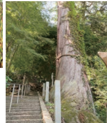
森の遍路道を行く「天野山八十八ヶ所巡り」もおすすめ。入口には千年杉がそびえます。