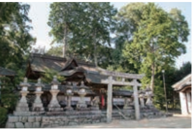
慶長13年(1608年)に建立された本殿。

Data 広域マップ：B-2 所在地 高向291 電話 0721-54-1007 参拝料 無料 時間 境内自由 休日 無休 アクセス 上高向バス停より徒歩1分