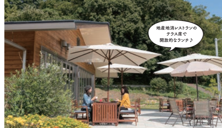
地産地消レストランのテラス席で開放的なランチ♪