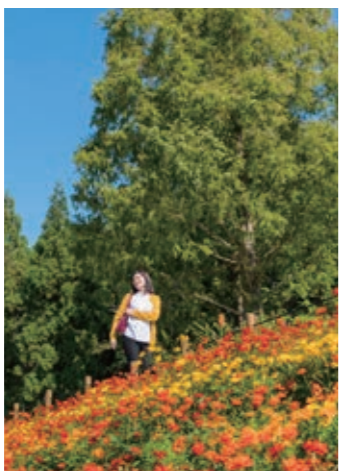
香り豊かな満開の花についで