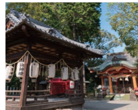
創建年は不詳。明治時代に西代神社と呼ばれるように。