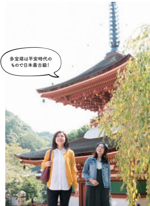
多宝塔は平安時代のもので日本最古級！