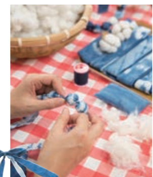
藍染め布に綿を詰め込んでネックレスに。綿繰り(種取り)も体験できます。