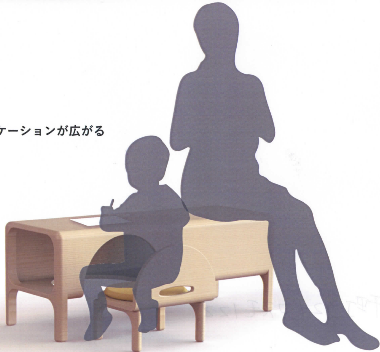
コミュニケーションが広がる

TEL 090-2045-5384 TEL 090-2045-5384 TEL 090-2045-5384