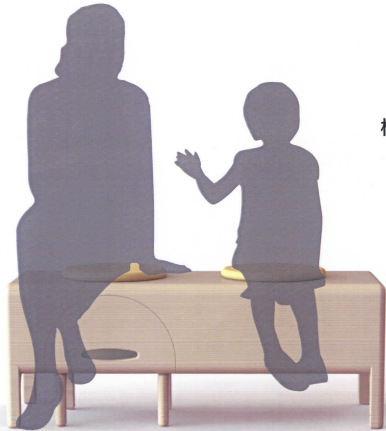
椅子をしまってクッションを乗せて親子のベンチに