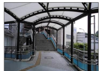
①河内長野駅と「ノバティながの」北館3階とを結ぶデッキから、北館・南館を結ぶ歩行者デッキにつながる階段部分